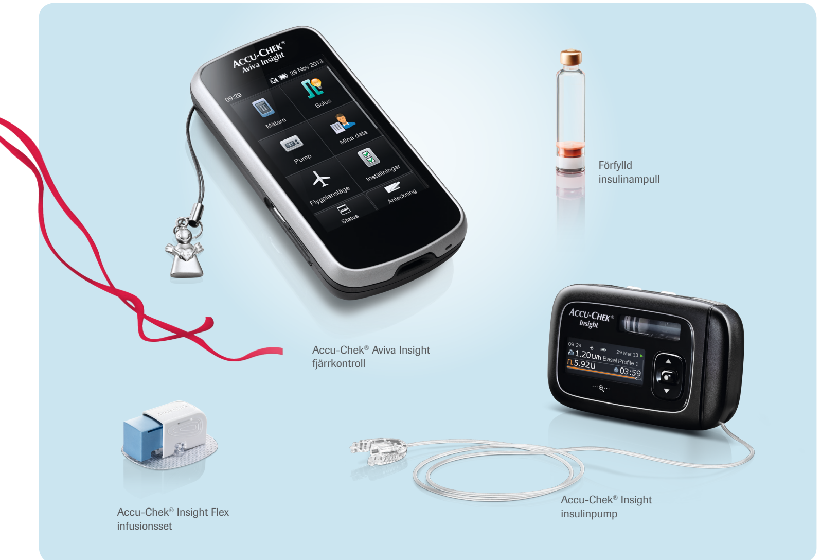
Accu-Chek® Aviva Insight fjärrkontroll